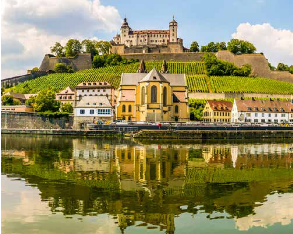
Panoramablick am Mainufer mit Schloss Marienberg und der Kirche At. Bukard in Würzburg