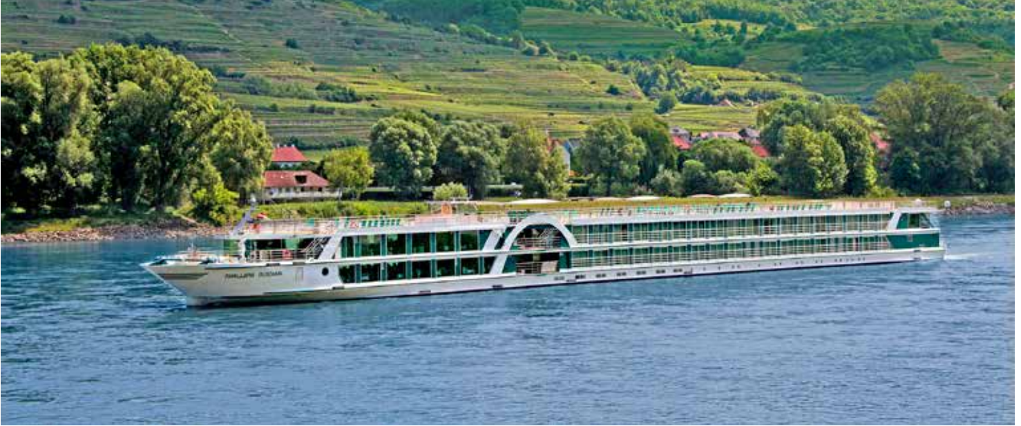
MS AMADEUS Brilliant